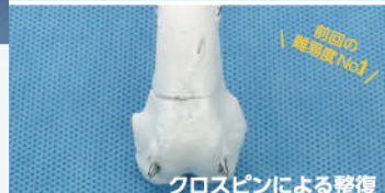
クロスピンによる修復